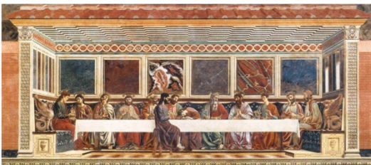
ANDREA DEL CASTAGNO (b. 1423, Castagno, d. 1457, Firenze) Last Supper 1447 Fresco, 453 x 975 cm Sant'Apollonia, Florence

2. גילוי האדם והטבע- האדם במרכז התמונה. האדם הוא מרכז היקום. מרכזיות האדם בתפישה הרנסנסית. אם בימי הביניים המרכז של תשומת הלב היה האל, החל מהתקופה הרנסאנסית הדברים מתהפכים. זה ראשיתה של התרבות החילונית, בה שמים את האדם במרכז היקום ולא את האל. הטבע כמושא להתפעלות עצמית. אחד הדברים שלומדים בתולדות האמנות זה שמתחילים לגלות ברנסאנס את כללי הפרספקטיבה. הציורים של הרנסאנס מנסים לשחזר את המציאות כפי שהיא, עם העומק שמאפיין את שדה הראייה של האדם. רוצים לשחזר את תפישת האמת הטבעית בריאליזם של הטבע. הומניזם = שמים את האדם במרכז. בימי הביניים האל היה במרכז, והחל מעולם הרנסאנסית, שמים את האדם במרכז היקום. גישה אפרצנטית במקום תאוצנטית