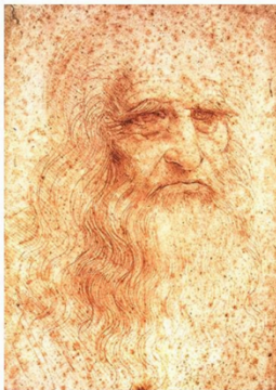
LEONARDO da Vinci (b. 1452 Vinci, d. 1519, Amboise)