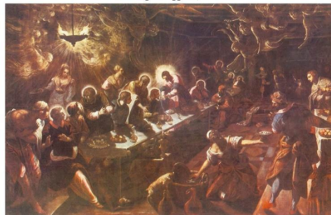
TINTORETTO, Jacopo The Last Supper 1592-94 Oil on canvas, 365 x 568 cm S. Giorgio Maggiore, Venice