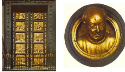
GHIBERTI, Lorenzo (b. 1378, Firenze, d. 1455, Firenze)