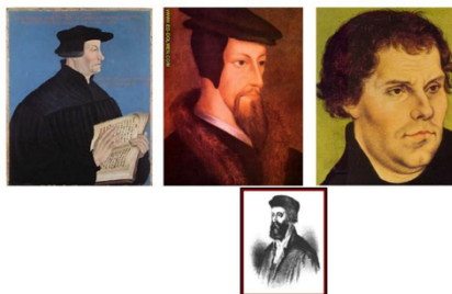
Lutero, Calvino, Zwingli

לוטרו, קאלוינו וזווינגלי - דמויות חדשות בעולם הפרוטסטנטי, העולם לא בעל אדם אחד שמשפיע עליו אלא יש כאן כמה דמויות שונות בעלות סמכות. אין דמות אחת.