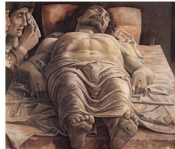
MANTEGNA, Andrea (b. 1431, Isola di Cartura, d. 1506, Mantova)