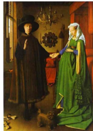
Jan Van Eyck The Betrothal of the Arnolfini, 1434 London, National Gallery